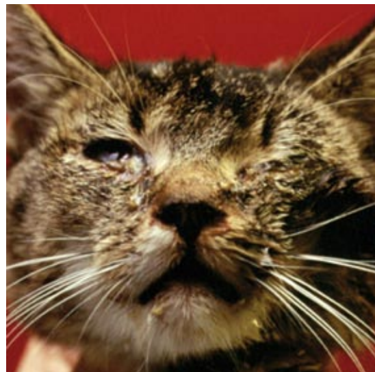
Abbeelding met dank aan Merial